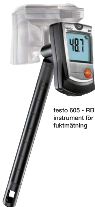
testo 605 - RBK-godkänt instrument för betong- fuktmätning