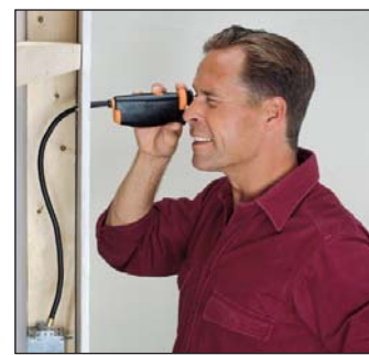
Snabbt konstaterande av skador på olika delar utan demontering

Ytterligare information! ring oss på 031-704 10 70 eller gå in på www.nordtec.se