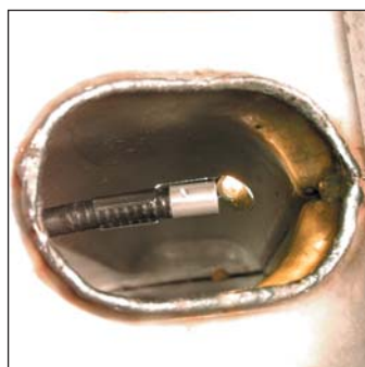
Snabb och komplett inspektion av värmväxlare med spegeltillbehör