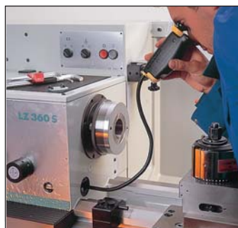
Kan användas vid felsökning