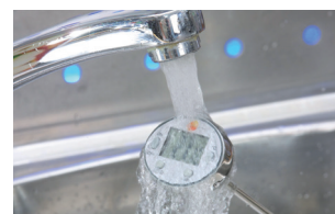
Skölj helt enkelt under rinnande vatten när den är smutsig.