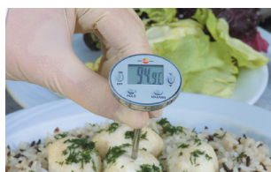
För temperaturkontrollmätningar inom livsmedelsproduktion