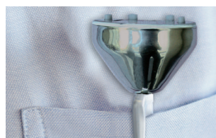
Skyddshylsa med fästclips. Alltid nära till hands.