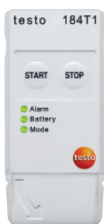
testo 184 T1

Översikt över dataloggrarna i testo 184 -serien.