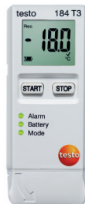
testo 184 T3