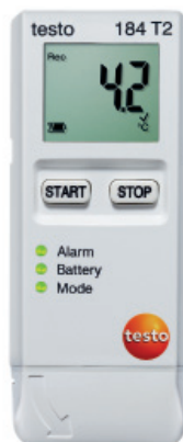
testo 184 T2