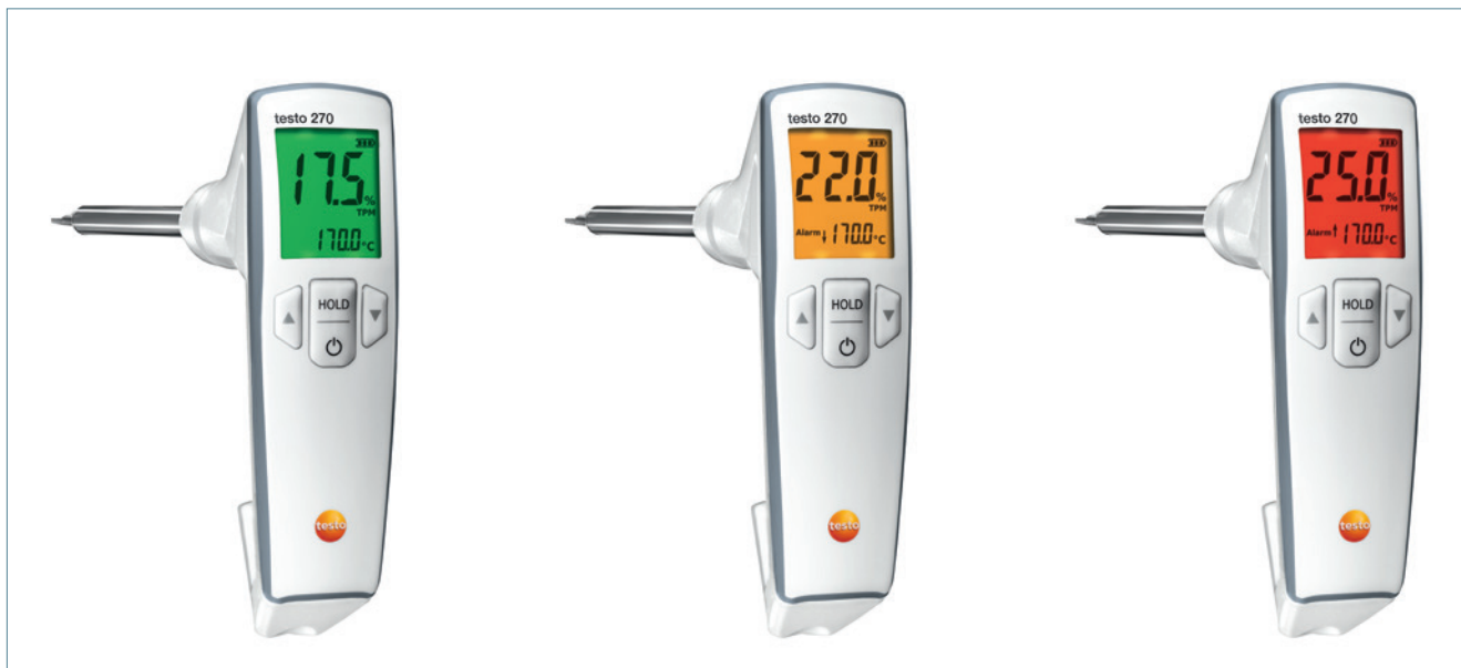
TPM-mätningar kan utföras med testo 270. Beroende på det uppmätta värdet lyser displayen grönt, gult eller rött.