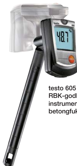
testo 605 RBK-godkänt instrument för betongfuktmätning